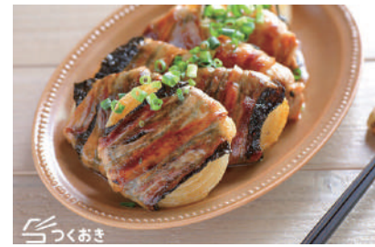
詳細はQRコードからどうぞ!